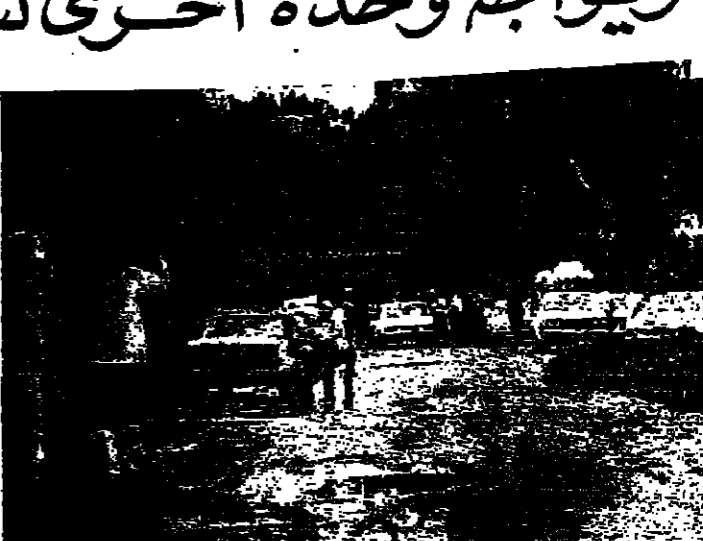
بوابة النامية بعد اعادة فتحها

وفي منطقة صور، استمر الاسرائيليون باقتال المعبر الرئيسي عند جسر القاسمية وذلك في محاولة لملء المنطقة عن باقي المناطق اللبنانية وهذا ما حمل الاهالي على سلوك طرق فرعية